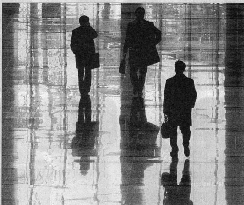
El mundo de la empresa es uno de los que más sufre la competencia y el estrés

De esta forma, la novela avanza poniendo en paralelo las dos caras de la sociedad, relacionando «los de arriba y los de abajo»: la competitividad feroz del mundo de la empresa se confronta con el de la marginación social y la miseria. El resultado de todo ello es un libro «trepidante y de lectura rápida»,